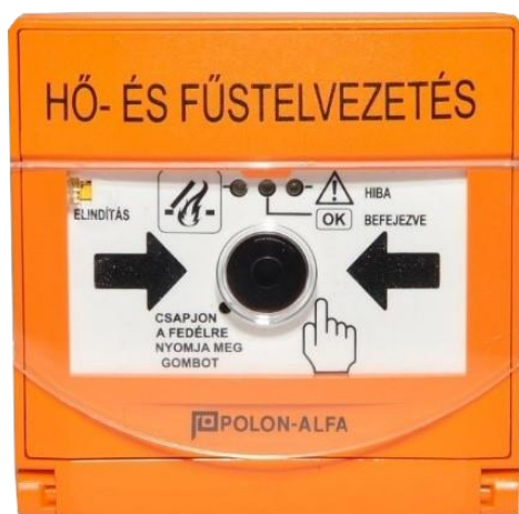
PO-63 kézi indító